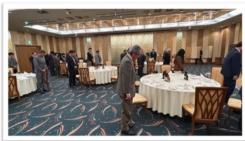
黙祷（令和6年能登半島地震で亡くなられた方へ）